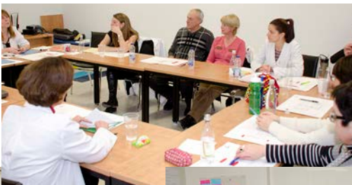
OPTIMISATION DE LA TRAJECTOIRE DE SOINS DE LA CLINIQUE D'INSUFFISANCE CARDIAQUE