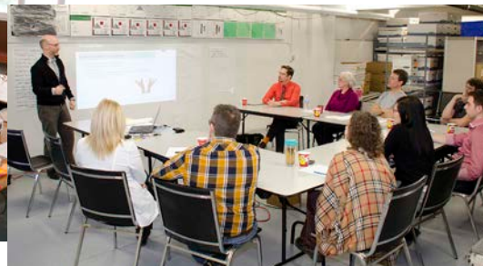
OPTIMISATION DE LA GESTION DU MATÉRIEL DE SOINS LOUÉ ET UTILISÉ DANS LES SECTEURS CLINIQUES