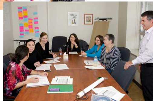
OPTIMISATION DU PROCESSUS DE DISTRIBUTION DES MÉDICAMENTS POUR LES PROTOCOLES DE RECHERCHE CLINIQUE