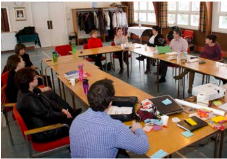
OPTIMISATION DU PROCESSUS DE GESTION DES FORMATIONS DU PLAN DE DÉVELOPPEMENT DES RESSOURCES HUMAINES (PDRH)