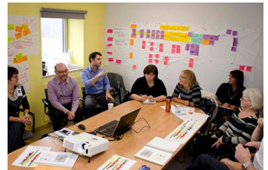
OPTIMISATION DU PROCESSUS DE RÉAPPROVISIONNEMENT EN MATÉRIEL