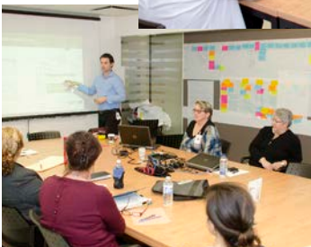
OPTIMISATION DU PROCESSUS DE PLANIFICATION ET DE GESTION DES LITS D'APNÉE DU SOMMEIL