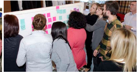
OPTIMISATION DU PROCESSUS DE SUIVI DES CLIENTS EN ONCOLOGIE