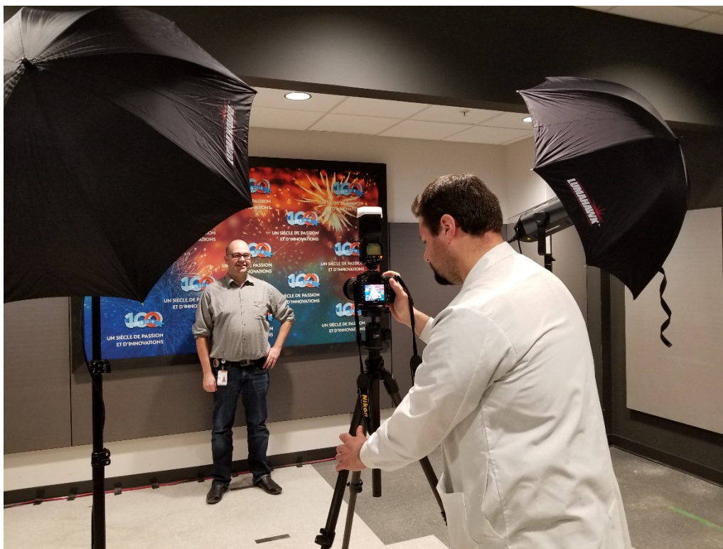
PHOTO-SOUVENIR DU CENTENAIRE

Dernière chance , venez vous faire photographier aujourd'hui dans le cadre de l'année du centenaire.